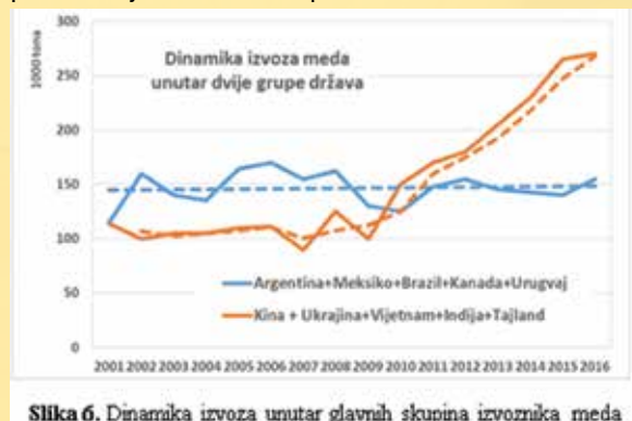
Slika 6. Dinamika izvoza unutar glavnih skupina izvoznika meda

Prema izvorima UN-ove Agencije za hranu i poljoprivredu (FAO), u razdoblju između 2001. i 2014. godine kineska je proizvodnja meda, potaknuta općim porastom izvoza roba iz Kine, porasla za 88 posto. Tijekom istog je razdoblja broj pčelinjih zajednica povećan za samo 21 posto. Pčelarstvo u Kini također ovisi o sličnim čimbenicima kao i drugdje u svijetu (gubitak staništa zbog urbanizacije, zagađenost pesticidima i drugo), a činjenica je i da ti čimbenici jako utječu na zdravstveno stanje i preživljavanje pčela te nužno dovode do opadanja broja pčelinjih zajednica. Ako je priznata činjenica da produktivnost, to jest prinos po pčelinoj zajednici u svijetu opada, kako onda kineske pčele mogu osigurati tako visok prinos? I kolika je onda vjerojatnost da bi povećanje broja pčelinjih zajednica za 21 posto moglo osigurati takvo povećanje proizvodnje!? Istodobno poznate slike kineskih voća-