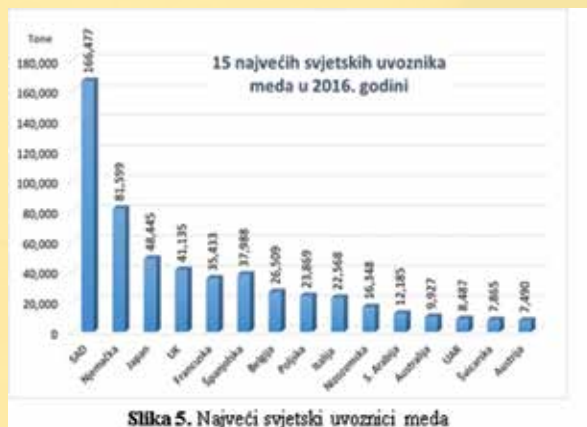
Slika 5. Najveći svjetski uvoznici meda

Osim Kine, u velike se izvoznike meda na svjetskom tržištu ubrajaju i Argentina (81.183 tone), Ukrajina (54.442 tone), Vijetnam (42.234 tone), Indija (35.793 tone)... Kad se to pretvori u novčanu vrijednost, riječ je o vrto-glavim iznosima. Naravno da je i u tome na prvome mjestu Kina, za koju se procjenjuje da joj izvoz meda donosi 270,7 milijuna dolara godišnje (11,3 posto svjetskog izvoza meda u 2017.), ali je pravo iznenađenje to što drugo mjesto drži Novi Zeland (s 268,1 milijun dolara vrijednim izvozom meda i 11,2 posto udjela na svjetskom tržištu u 2017. godini).