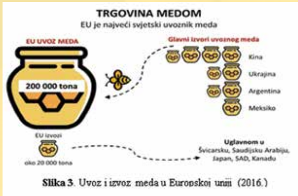
Slika 3. Uvoz i izvoz meda u Europskoj uniji (2016.)

Zanimljivo je da je upravo u 2018. godini, godini koja je predstavljala prijelazno razdoblje do pune primjene novih odredbi Pravilnika o medu vezanih uz obavezno deklariranje zemlje/zemalja podrijetla meda, uvoz