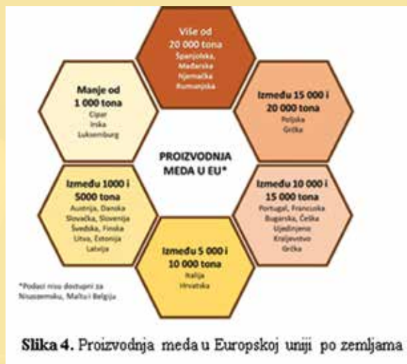
Slika 4. Proizvodnja meda u Europskoj uniji po zemljama

meda u Hrvatsku iz trećih zemalja narastao na vrto-glavih 2000 tona. I to službeno. To je porast uvoza od gotovo 300 posto u odnosu na 2016. godinu. Opravdano se možemo pitati je li riječ o spremanju zaliha za „crne dane“ uvoznika, to jest za razdoblje poslije datuma nakon kojeg se podrijetlo meda na hrvatskom tržištu mora jednoznačno navesti (1. siječnja 2019.).